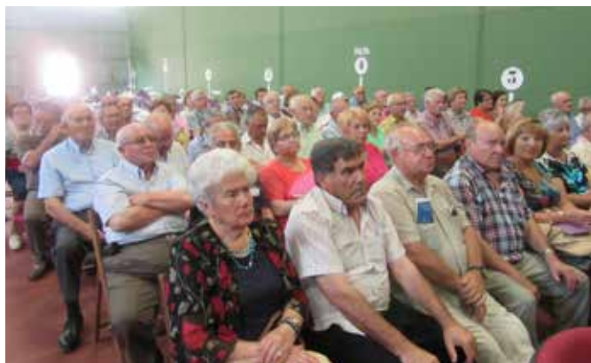
Arcas del Villar