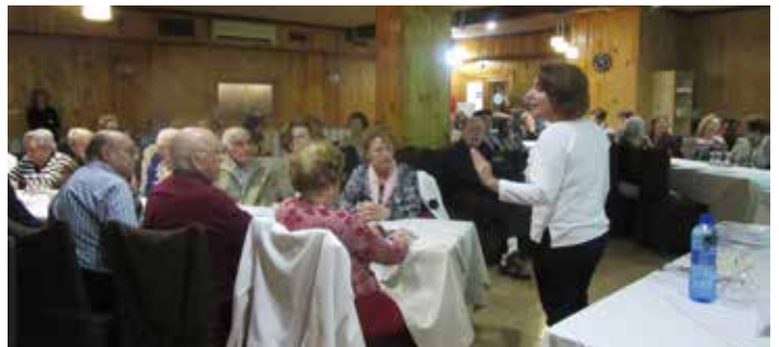
Carpio de Tajo