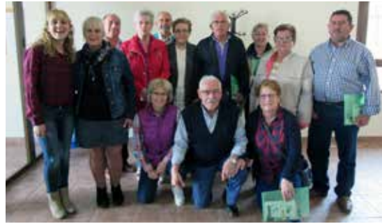
Arcas del Villar