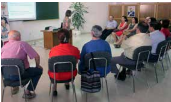
Campo de Criptana