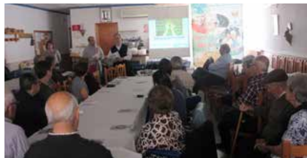
Corral de Calatrava