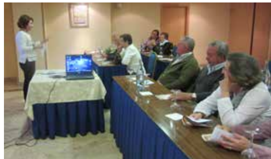
Talavera de la Reina