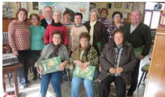
Puebla de Almoradiel