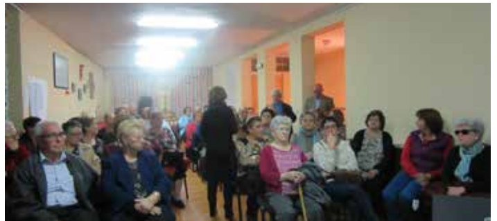
Talavera de la Reina