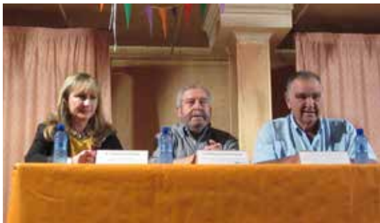
Alberca de Zancara