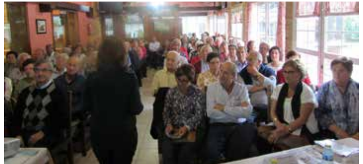
Puebla de Don Rodrigo