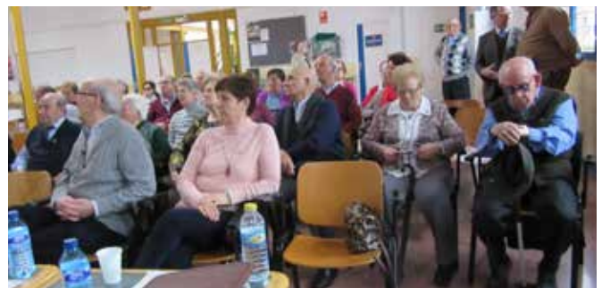
Villanueva de Alcardete