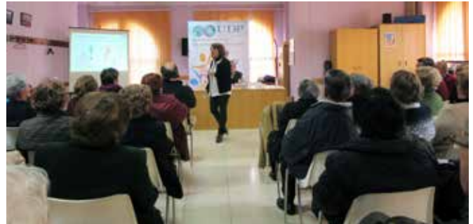
Valera de Abajo