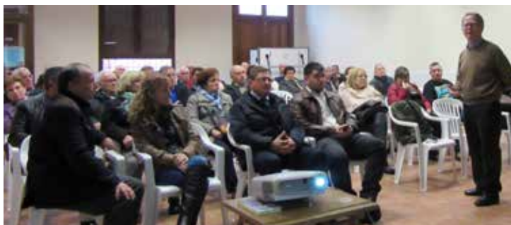
Arcas del Villar