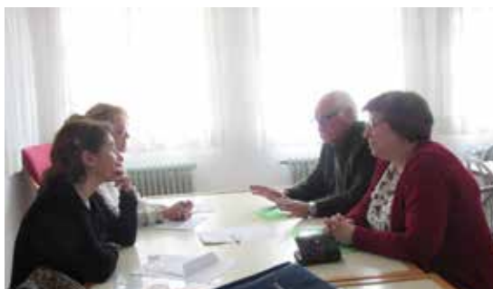
San Lorenzo de la Parrilla