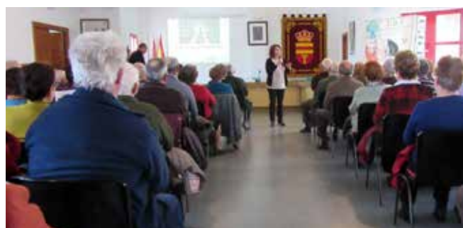
Puebla de Almoradiel