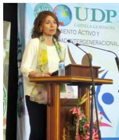
Arcas del Villar